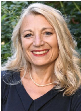
Yvonne Feri, SVA-Präsidentin

Seit der Generalversammlung 2024 ist der Vorstand unseres Verbandes wieder vollständig besetzt. Wir haben das Glück, in unseren Reihen über kompetente Fachpersonen zu verfügen, die ihre Kenntnisse und ihre Zeit in den Dienst unseres Verbandes stellen. Dieses Engagement ist enorm wertvoll. Als Fachpersonen sind wir in unserer täglichen Arbeit in vielerlei Hinsicht stark gefordert. Umso wichtiger ist es, dass wir unsere Interessen als Verband in gebündelter Weise nach aussen tragen.